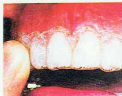
Nella foto più in alto, la prima fase del bleaching, cioè l'inserimento del gel sbiancante nel «cucchiaio». Questo viene poi applicato (sopra) a pressione sull'arcata dentale.